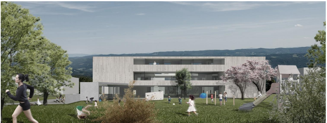
Haus der Generationen, nördlich der Raika Volders

Haus der Generationen, Schönwerth-Park 1, 6111 Volders Öffentliche Ausschreibung gemäß § 81 Tiroler Gemeindeordnung